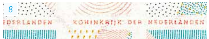
"KONINKRIJK DER NEDERLANDEN" (papieren pagina's)